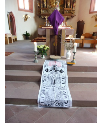
Karfreitag Zum Ende gehen