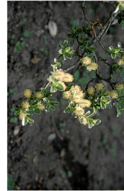
Palmsonntag Den König sehen