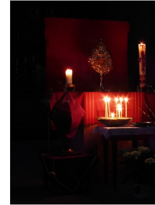
Gründonnerstag Weite und Tiefe der Liebe