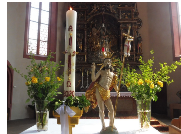
Osterfest Du führst mich hinaus ins Weite Durch die Karwoche und die heiligen drei Tage (Bilder ohne die gemeinsamen Feiern im Jahr 2020)

Am Blumenstand Nimm lieber die Tulpen, die halten länger. Ist doch egal, sagt er, gelb ist hübscher. Und vergehen müssen wir doch alle einmal, früher oder später. Und kauft einen großen Strauß Osterglocken.